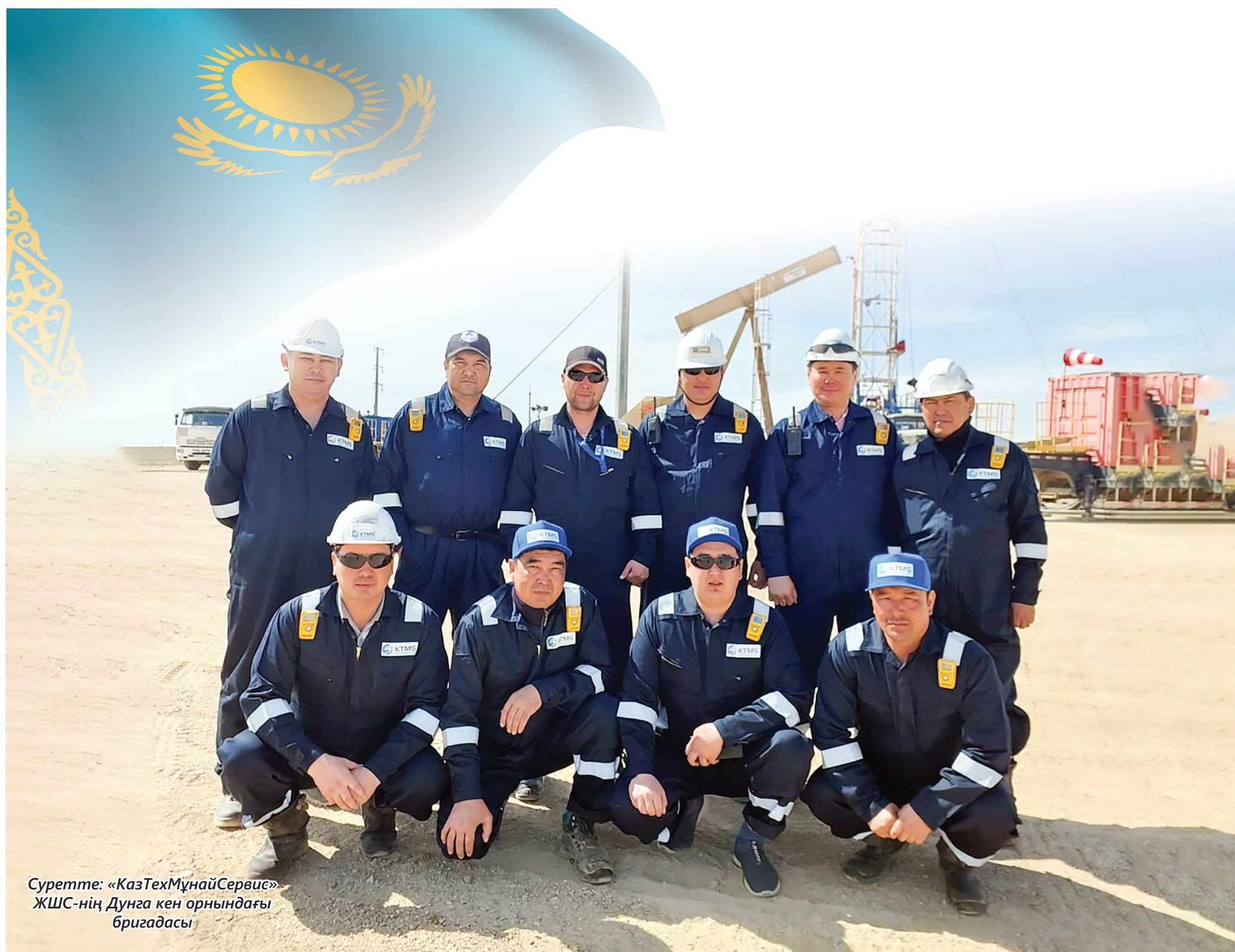
Суретте: «КазТехМұнайСервис» ЖШС-нің Дунга кен орнындағы бригадасы